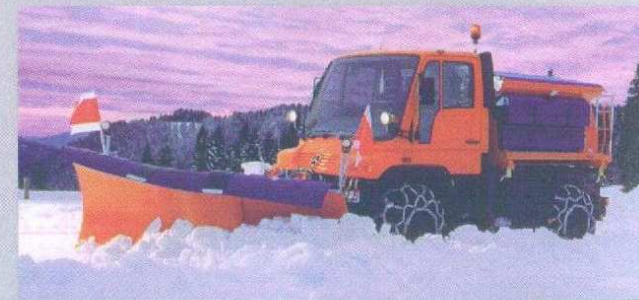
UNIMOG avec saleuse et étrépe