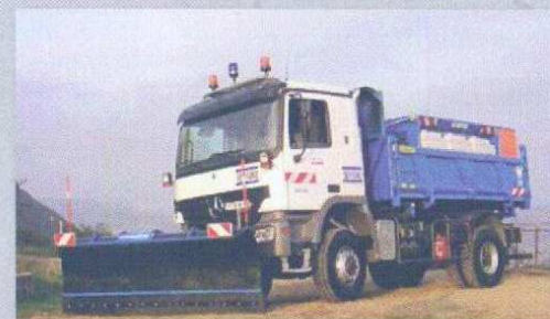
ACTROS 4x4 avec saleuse et lame