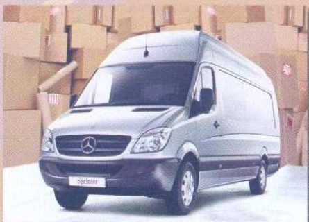
SPRINTER fourgon simple ou double cabine 4x4 ou 4x2