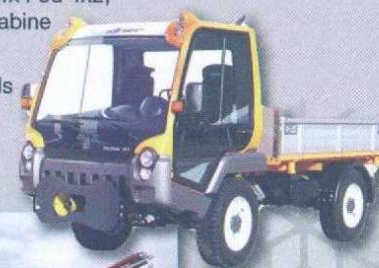
LINDER porte-outils 4 roues directrices