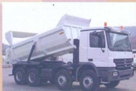
ACTROS 6x4 ou 8x4, benne ronde ou bi-benne