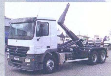
ACTROS 6x4 multi-benne