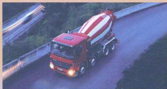
ACTROS 8x4, malaxeur de béton