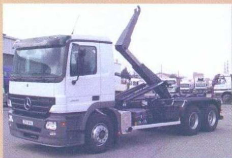
ACTROS 6x4 multi-benne