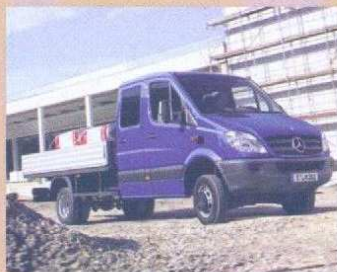
SPRINTER 4x4 fourgon ou benne