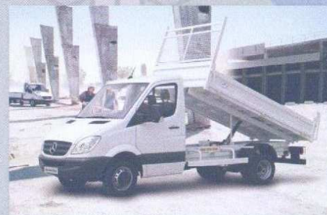
SPRINTER benne, 4x4 ou 4x2, simple ou double cabine

Location de véhicules dédiés au service hivernal comme à tout autre service.