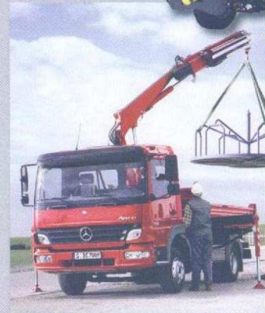
ATEGO benne ou plateau/grue