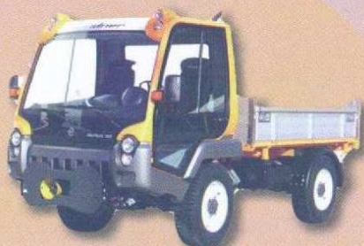
LINDER porte-outils 4 roues directrices