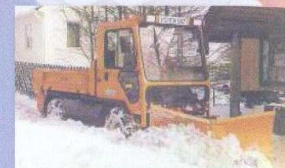
LADOG avec lame de déneigement variable et saleuse à rouleaux matériel 4 roues directrices