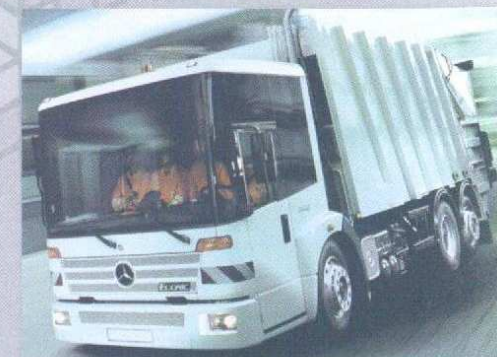
ECONIC avec BOM