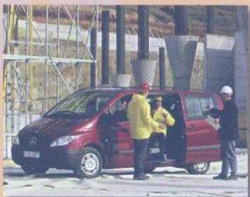
VITO Fourgon, combi, 4x2, 4x4

A votre disposition, des matériels de location tout équipés. La durée ?... c'est vous qui décidez.